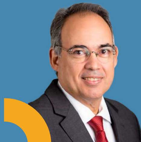
Henrique Vasconcelos Diretor do Rotary Internacional

Também neste mês, será realizada em Orlando, nos Estados Unidos, a Assembleia Internacional 2025. Anualmente, o Rotary International organiza esse treinamento que reúne rotarianos do mundo inteiro, com todos os nossos governadores de distrito do ano rotário seguinte e seus cônjuges. Na Assembleia Internacional formatamos uma só voz para todos os distritos, por meio dos governadores, que replicarão em seus clubes a nossa mensagem anual (a partir de 2025-26, não teremos mais lema anual, e sim mensagem anual).